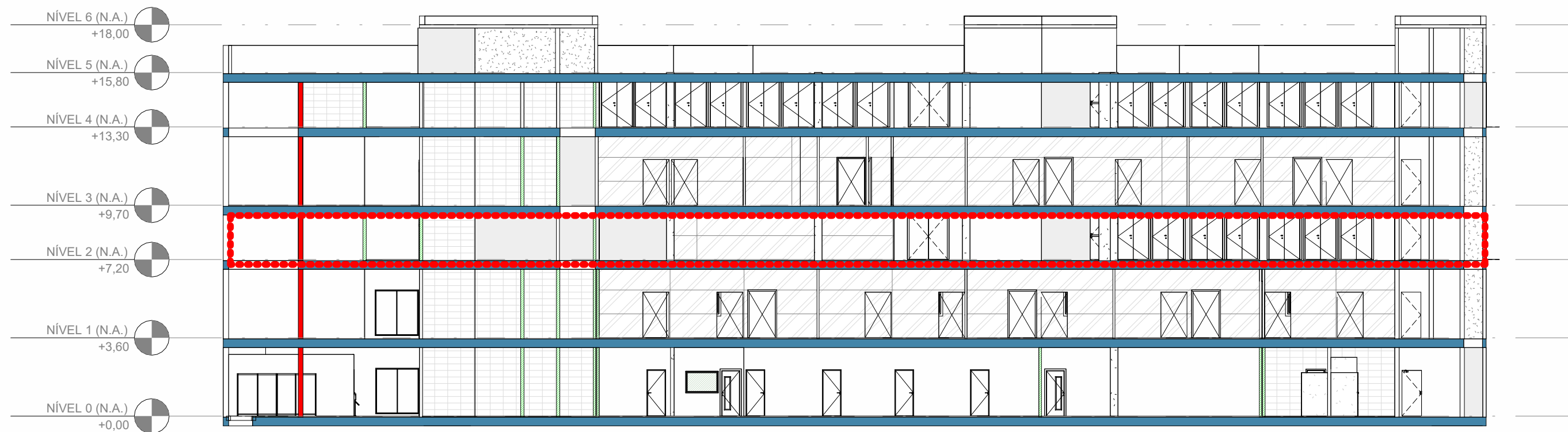
2 CORTE - LOCALIZAÇÃO NO PAVIMENTO -N2 ESCALA 1 : 200